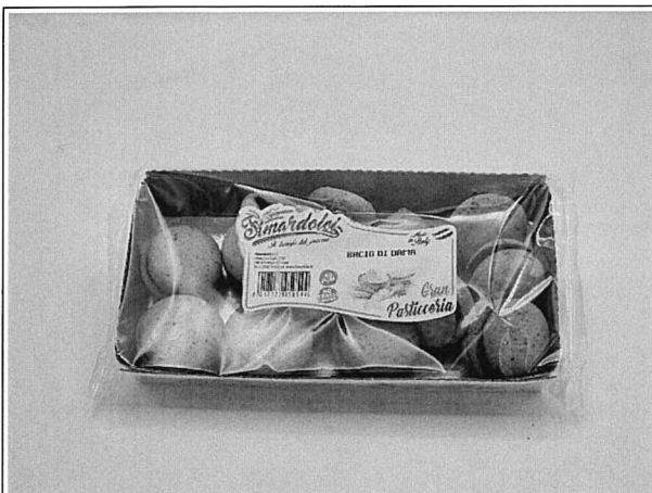
Inserire immagine uno:

In via cautelativa si chiede di non consumare il prodotto e riportare la merce presso il punto di acquisto.